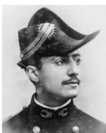
André-Louis Cholesky (1875-1918)

racineCarreeMatriceSymetriquePositiveDecompositionPolaire