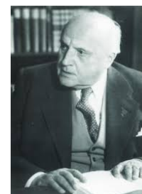
Erhard Schmidt (1876-1959)