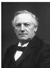
Jørgen Pedersen Gram (1850-1916)