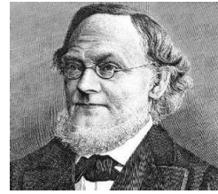
Hermann Günther Grassmann (1809-1877)